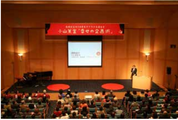
30周年サプライズ講演会(1/28 小山薫堂氏)