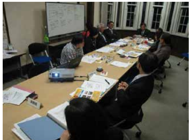
30周年検討委員会(9月~12月)