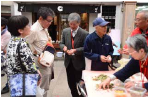
長崎伝習所まつり(3/21)②