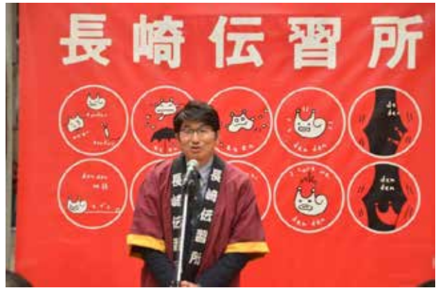
長崎伝習所まつり(3/21)①