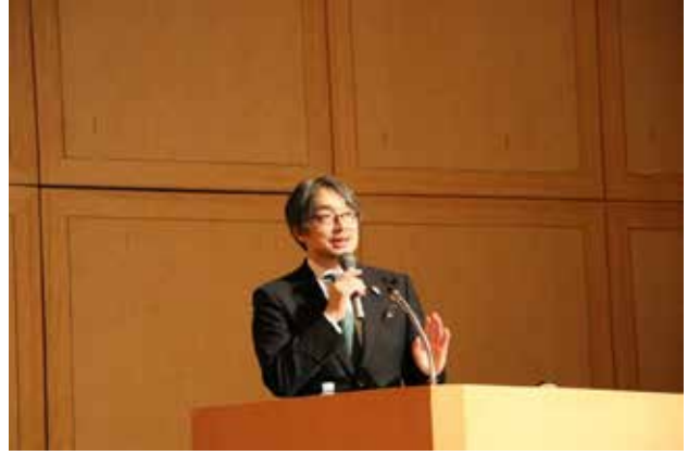
30周年サプライズ講演会(1/28 小山薫堂氏)