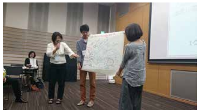
50人ワークショップ(10/10)