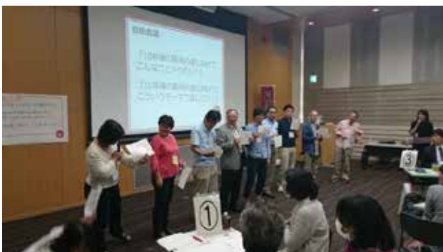
50人ワークショップ(10/10)