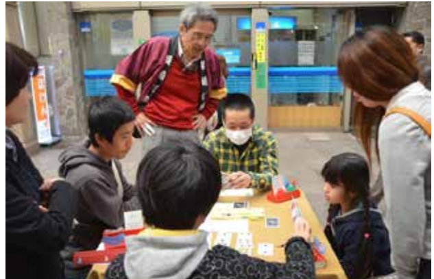
長崎伝習所まつり(3/21)③