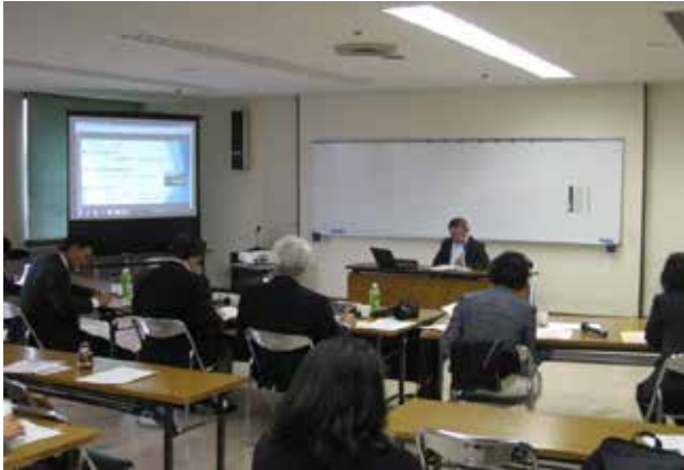
28年度「塾」企画審査会(2/14)