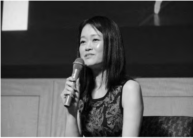
自分新化講座 第5回(10/11)