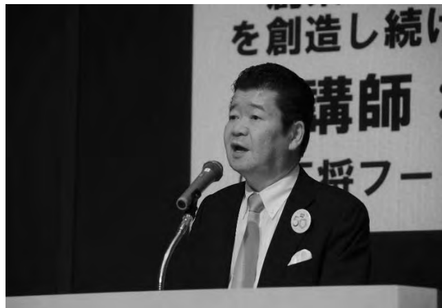
自分新化講座 第2回(7/19)