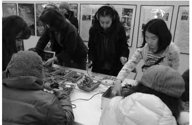
長崎伝習所まつり(3/21)②