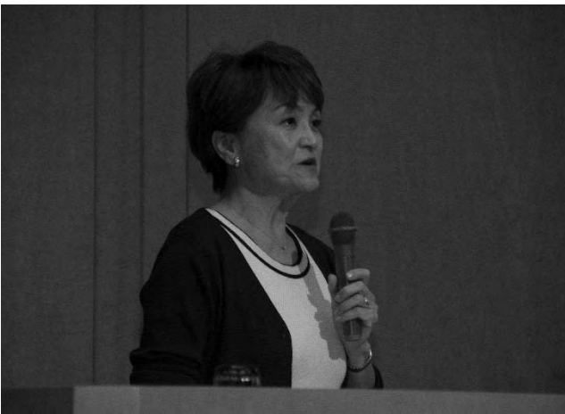
自分新化講座 第3回(8/1)