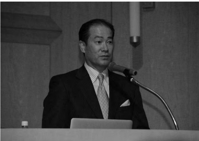
自分新化講座 第1回(6/21)