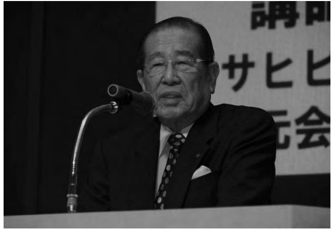
自分新化講座 第6回(11/22)