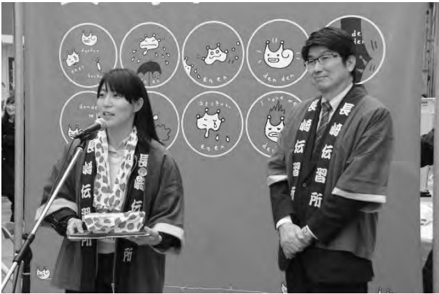
長崎伝習所まつり(3/21)①