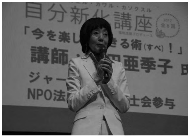
自分新化講座 第4回(9/13)