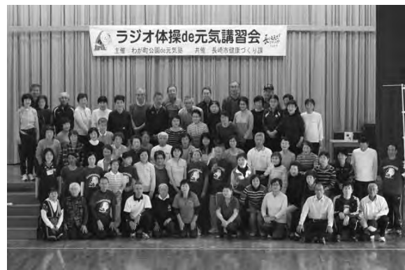
参加者全員での記念撮影