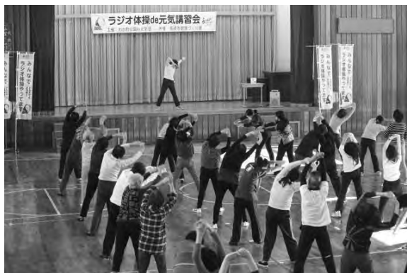
真剣に取り組む参加者