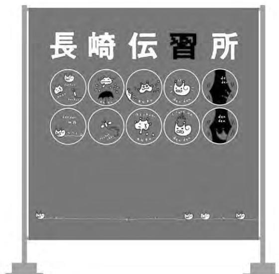
▲ バナー：タテ 230×ヨコ 230 cm