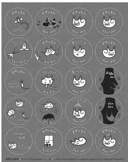
▲ 円形シール：直径 2.5cm(1 シート 20 枚)