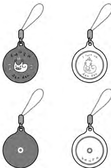
▲ 円形本体：直径 2.7cm(磁器)