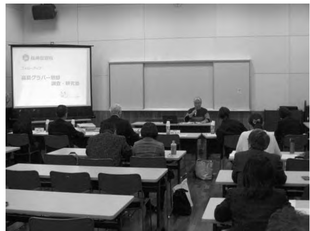
フォローアップ補助金審査会